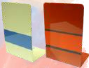
ブックスタンド 中