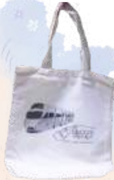
エンジ トートバック