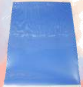
青帯 A4 インテリアフル