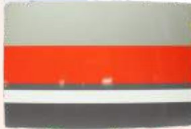
各車形デコラ塗装板