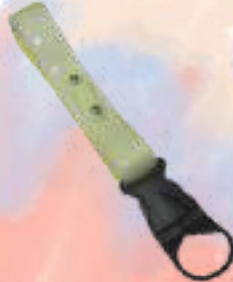
ペットボトルホルダー