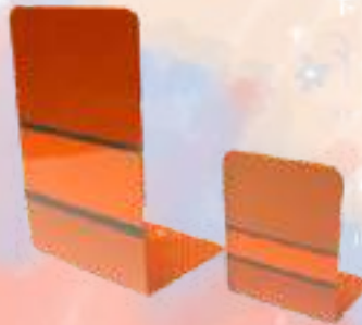
ブックスタンド 小