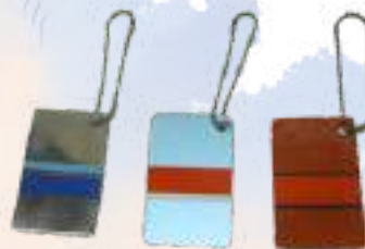
外板キーホルダー